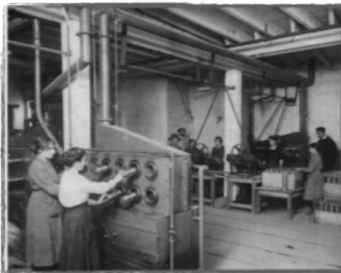
Munitionnettes dans l'usine d'artillerie du boulevard Michelet