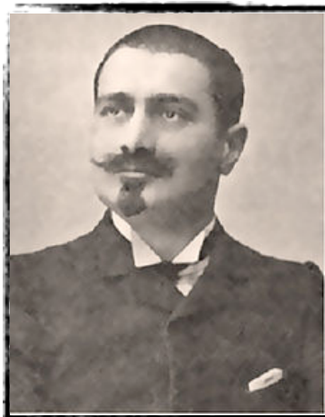
Alexandre Blanc député du Vaucluse, participe à la conférence de Kienthal en 1916